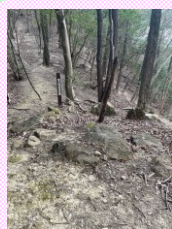
⑦宮内恒吉8号墳 (宮内古墳群)