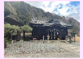
スタート地点の宮内天満神社