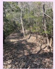
④分岐点には道標あり

天神山は、たつ市の新宮町宮内にあります。標高は167.8m、神奈備山型の美しい三角形の山容を誇る山で、「播磨国風土記」には飯盛山と記されています。宮内天満神社の裏にある登山口から入山でき、天神山の頂上までは200m程の道のりなので、どなたでも気軽に登ることができます。登っている途中に道標があり、その先に吉島古墳があると知り、少し足をのびして登ってみることにしました👉