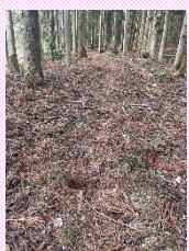
⑧西播磨文化会館裏

形は前方後円墳で、築かれたのは3世紀半ば頃、日本最古級の古墳として知られています。標高は250m程で、後半はジグザグで少し急な上り坂です。眺望はありません。この時期は落ち葉が積もっていて足元が滑りますので、ご注意ください⚠️