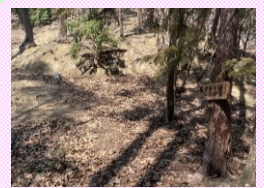
⑤このあたりからはピンクテープを辿っていく