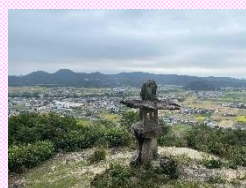
愛宕神社からの眺望