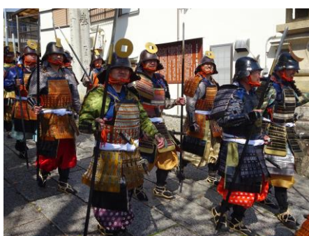
龍野武者行列の様子

また、今年度はたつの市制20周年ということで、例年と比べて趣向を凝らしたイベント等を開催し、お祝いムードを盛り上げていきたいと思います。