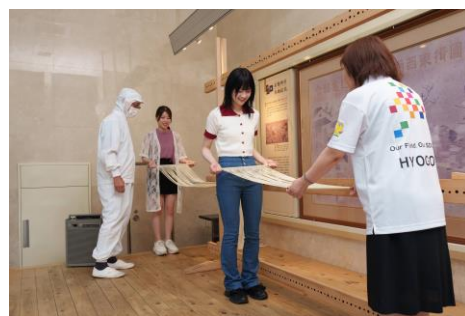
ひょうごフィールドパビリオン体験プログラムを体験中の様子

4月13日に大阪・関西万博が開幕され、万博を契機とした観光に期待が寄せられています。当協会といたしましては、8月に万博会場周辺で開催される「ひょうご楽市楽座」にブース出展するとともに、ひょうごフィールドパビリオン体験プログラムなどの観光資源をPRし、観光誘客につなげて参りたいと存じます。