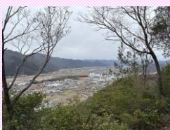
⑤ところどころに眺望あり