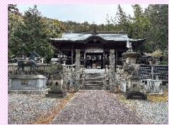
①登山口は椰八幡神社のすぐ後ろ