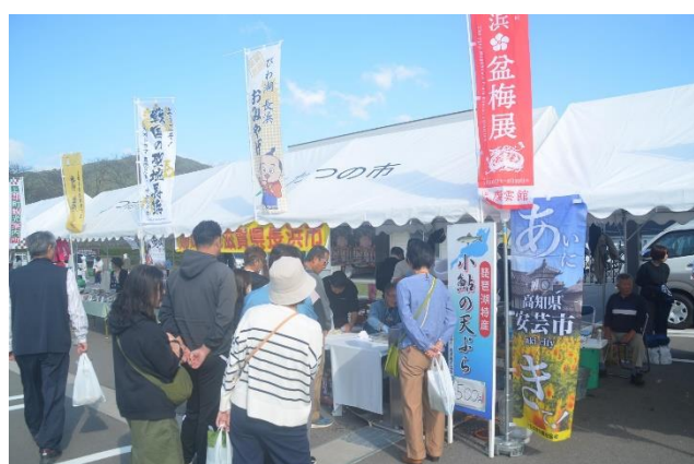
姉妹都市出店ブースの様子