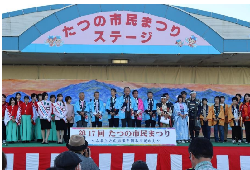
井戸 たつの市民まつり運営委員会副委員長挨拶の様子