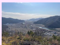
⑥あずまやからの眺望