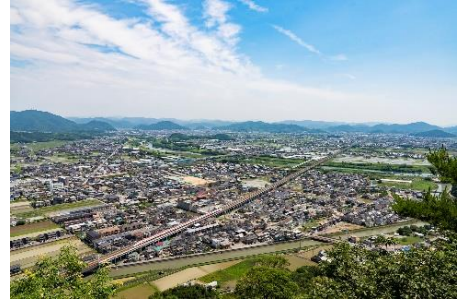
ヤッホの森からの眺望

自然あふれる里山の中にある総延長 5,250mの散策道。道沿いには多数の古墳が点在し、珍しい植物も見られます。黍田富士(きびたふじ)山頂の展望デッキからは揖保川やたつの市街の町並みが一望でき、近くに設置されている「幸せの鐘」が美しい音色を奏でます。