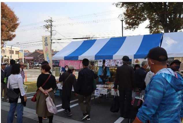
たつの市観光協会出店ブースの様子

また、姉妹都市から安芸市観光協会（高知県安芸市）、長浜観光協会（滋賀県長浜市）、特定非営利活動法人みたか都市観光協会（東京都三鷹市）に参加していただき交流を深めました。