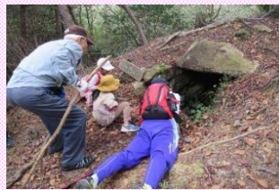
横穴式石室の古墳

黍田、金剛山の境の尾根の頂上に、巨石を組み合わせた古墳の石室が露出しています。石の組み方から7世紀の古墳と考えられます。展望台からは、瀬戸内海や家島諸島も一望でき、絶好のビューポイントです。