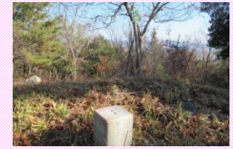
三角点展望台(宝記山)

ヤッホの森には6世紀~7世紀の古墳が多数あります。埋葬施設の出入口が横にあるので横穴式の石室と呼ばれます。埋葬された人たちは、かつてこの地で活躍した有力者で、当地区を今も見守っています。