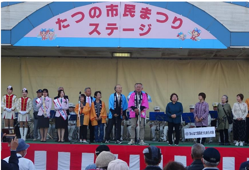
井戸 たつの市民まつり運営委員会副委員長挨拶の様子

11月3日（金・祝）、たつの市役所及び中川原グラウンド周辺において、第16回たつの市民まつりが開催されました。