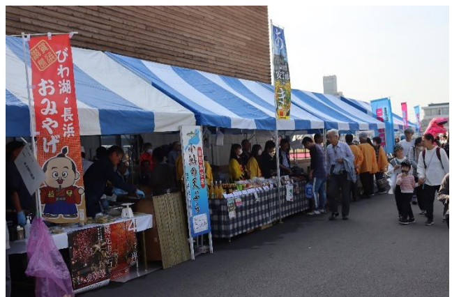
姉妹都市出店ブースの様子