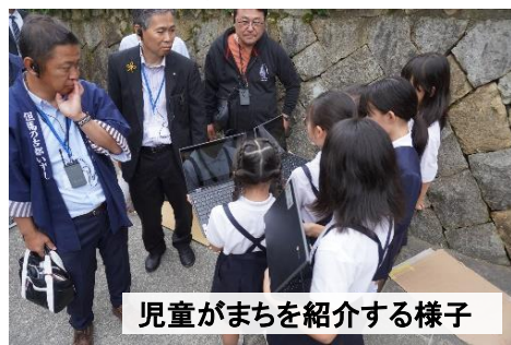
児童がまちを紹介する様子

また、この全国京都会議の開催を契機に、「播磨の小京都 龍野」の魅力を発信するため、20日（金）～22日（日）にかけて「龍野 de 愛（であい）イベント」を実施いたしました。当イベントでは、着物の散策やフォトコンテスト、スタンプラリー、武将