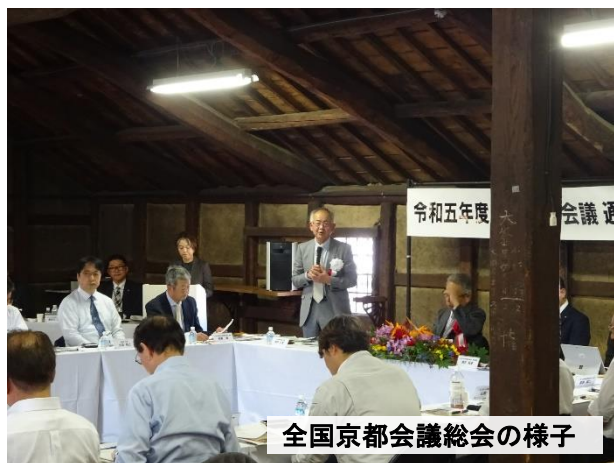
全国京都会議総会の様子

さる10月19日（木）みの劇場において、全国の小京都・京都ゆかりの市町の皆様をお迎えし「令和5年度全国京都会議」を開催いたしました。龍野地区は、「播磨の小京都」と言われて久しく、たつの市初となる全国京都会議の開催は、とても感慨深いものでありました。また、翌日のエクスカージョンでは、井戸糰製造所やうすくち龍野醤油資料館、霞城館