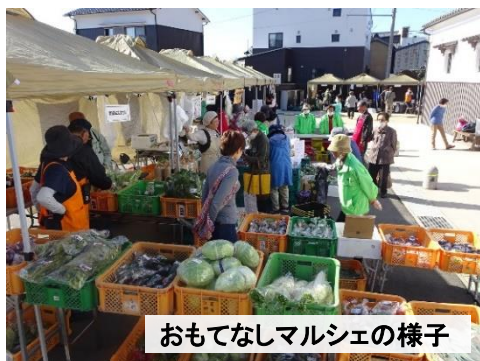
おもてなしマルシェの様子

着付け体験、おもてなしマルシェ、小京都PR展などを催し、大勢の方々にご来場いただき盛況にて無事終わることができました。ひとえに、近隣住民、事業所の皆様、出店者の皆様、運営スタッフの皆様、そして、ご来場いただいた皆様のおかげでございます。心より感謝申し上げます。