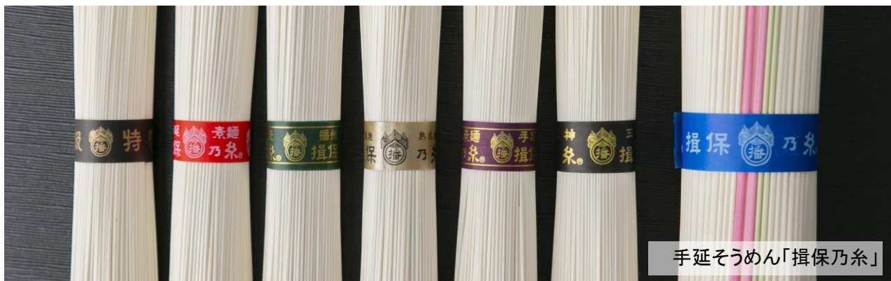
手延そうめん「揖保乃糸」

発行：たつの市観光協会 電話：0791-64-3156 URL： https://tatsuno-tourism.jp/