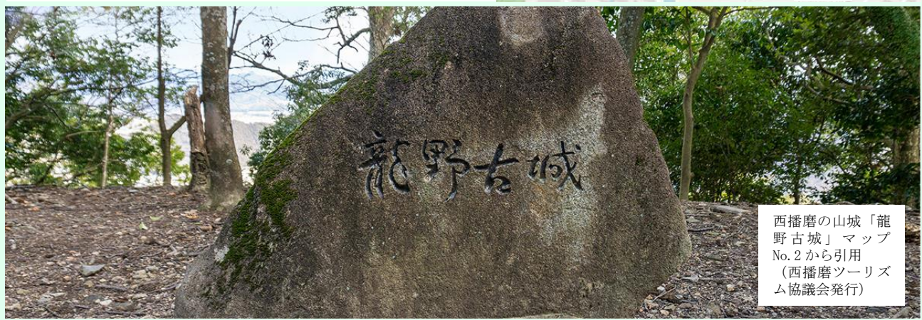
西播磨の山城「龍野古城」マップ No.2 から引用 (西播磨ツーリズム協議会発行)